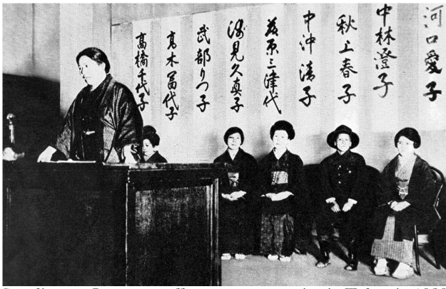
Standing up: Japanese suffragettes at a meeting in Tokyo in 1928

野村 たまたま荒川区議のSKさんと知り合い、SKさんはフェミ議連の共同代表で、「今度総会やるからいらつしやいよ」と言われて、行きました。その時SKさんが「お金もらって市民運動が出来るから、いいのよ」と言い、私は「そうか!」と思いました。